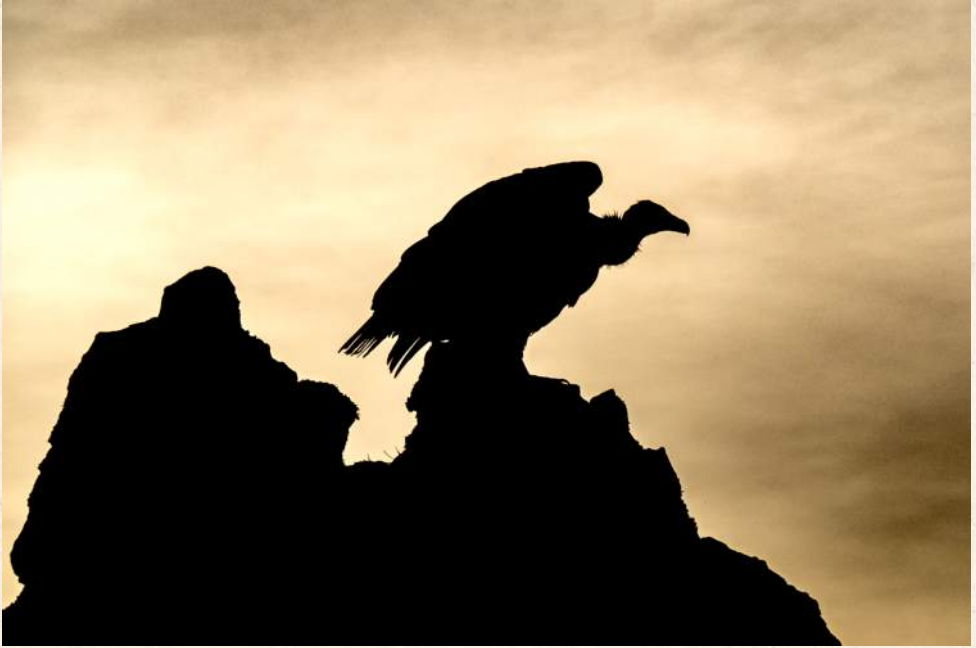
Salto de Gitano, Monfragüe.