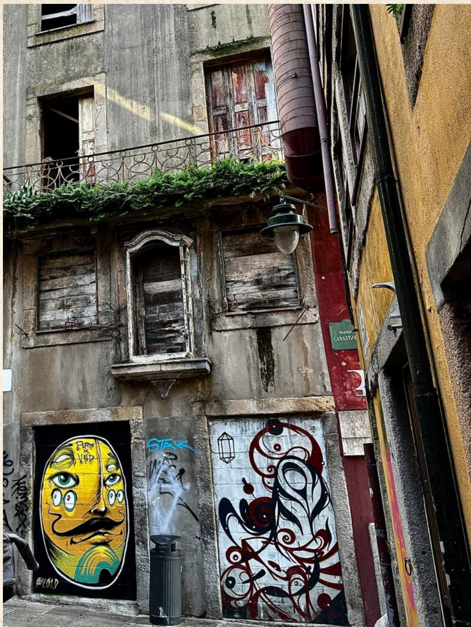
Fantasma do casco velho.