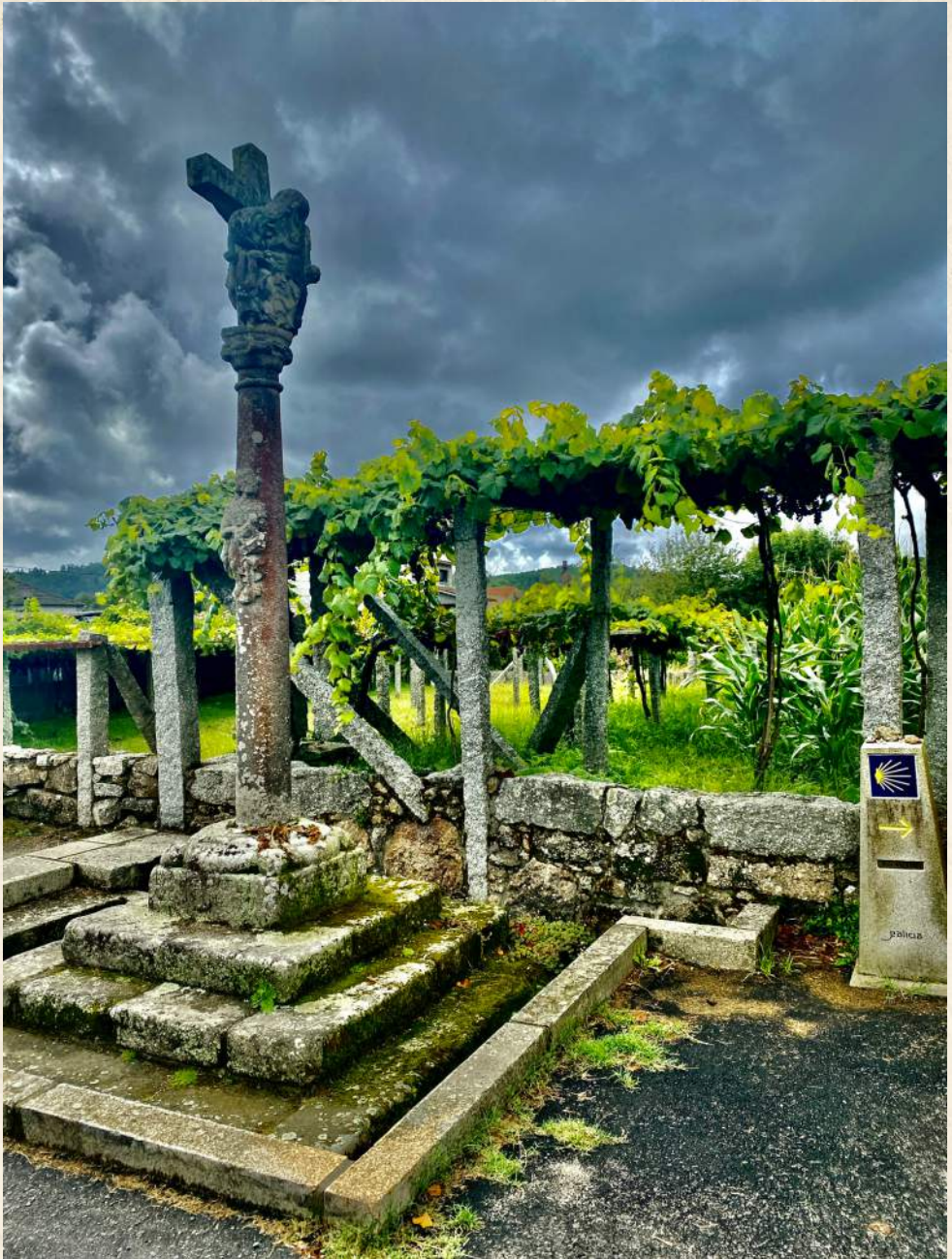
Alma en piedra.