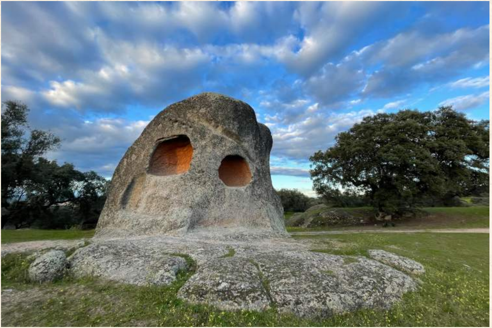
Peña Buraca, Alcántara.