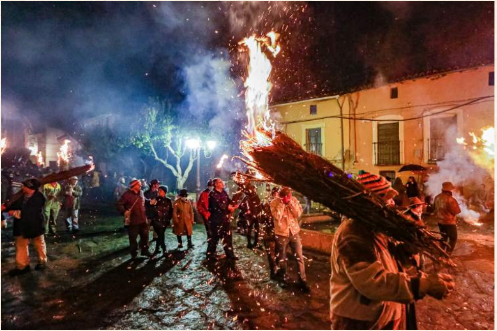
Los Escobazos, Jarandilla de la Vera.