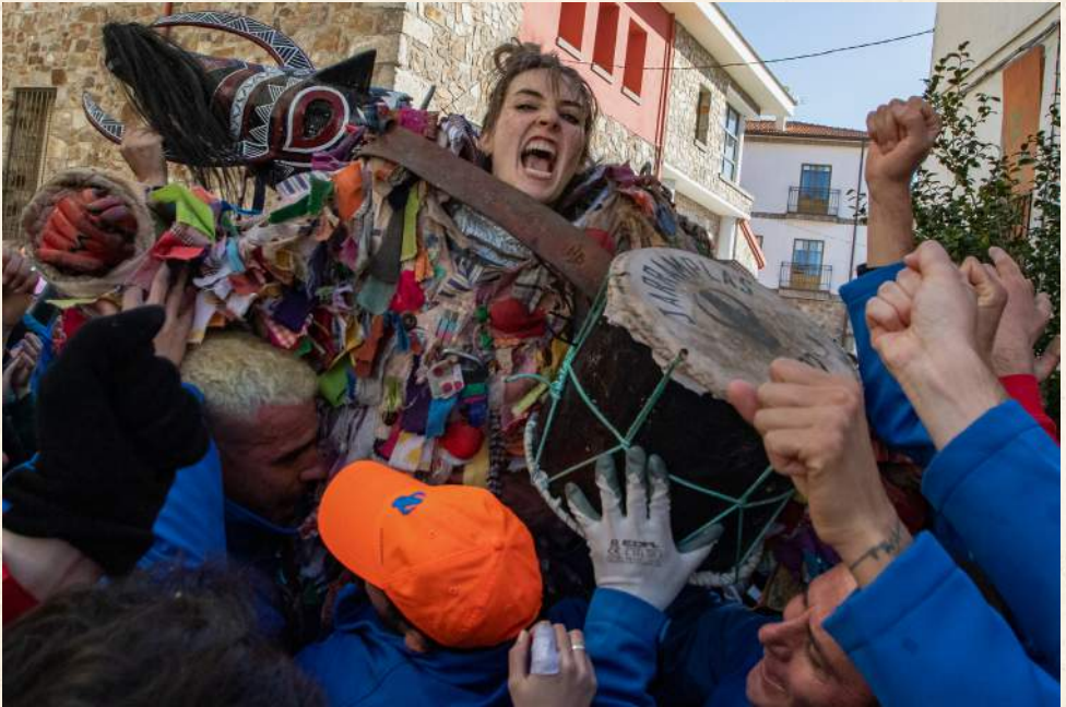
Mujer Jarramplas, Piornal.