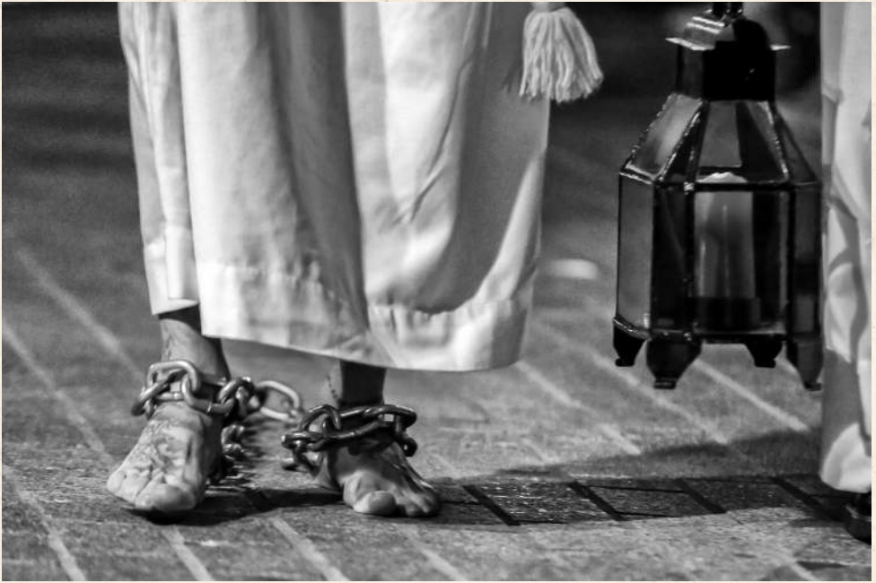
Semana Santa, Cáceres.