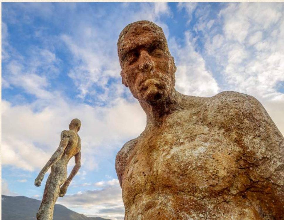
Monumento de la memoria, El Torno.