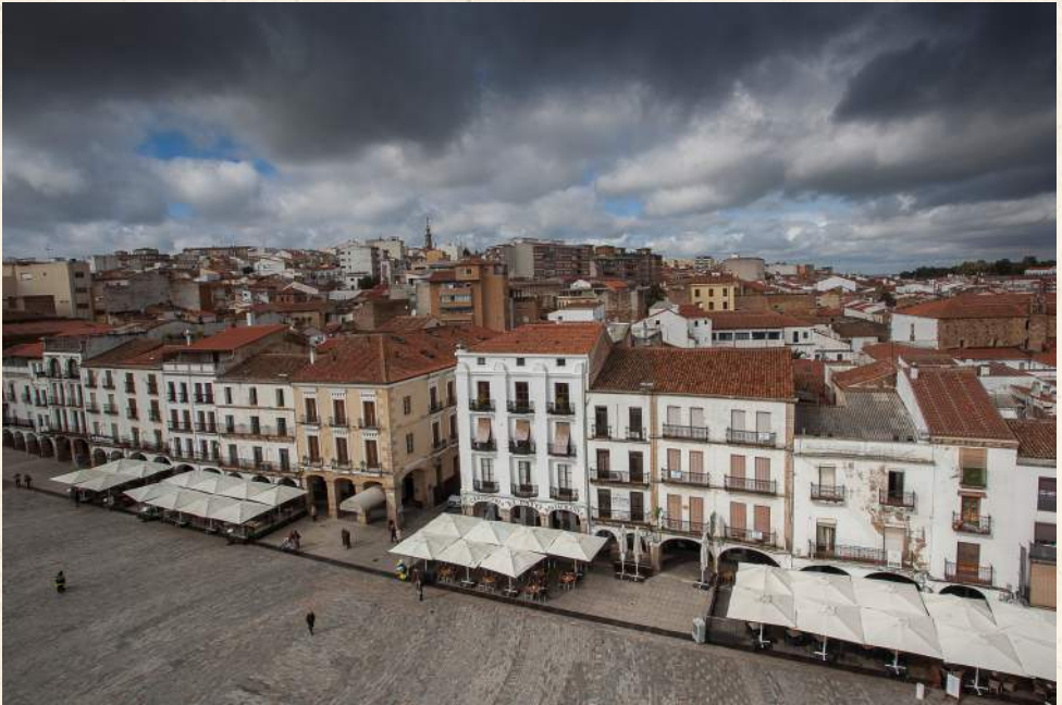
Plaza Mayor de Cáceres.