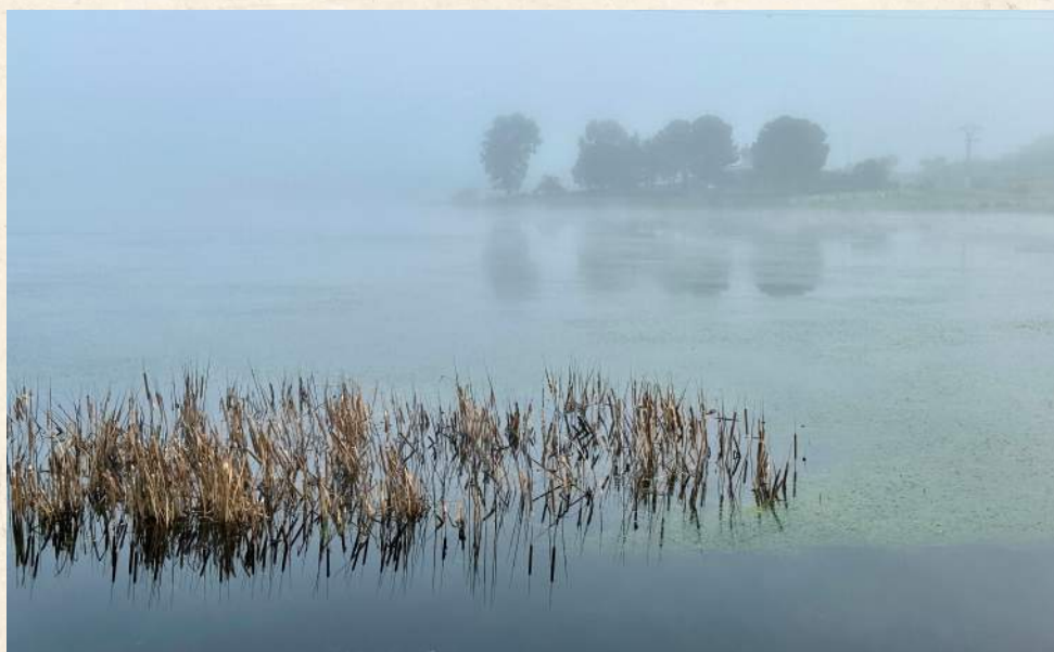
Humedad de la luz.