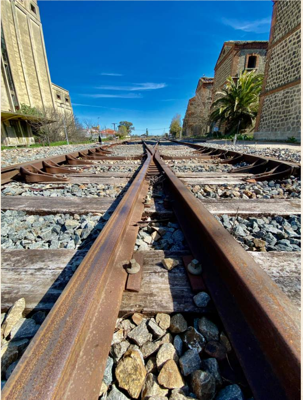
El paso del tiempo.