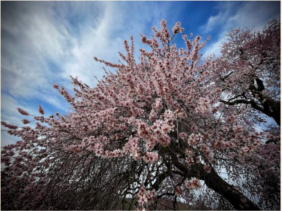
Almendo Real, Valverde de Leganés.