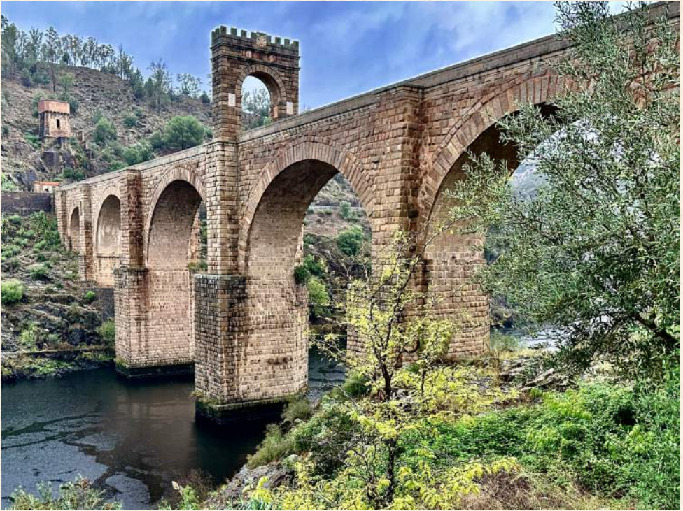
Ojos de piedra.