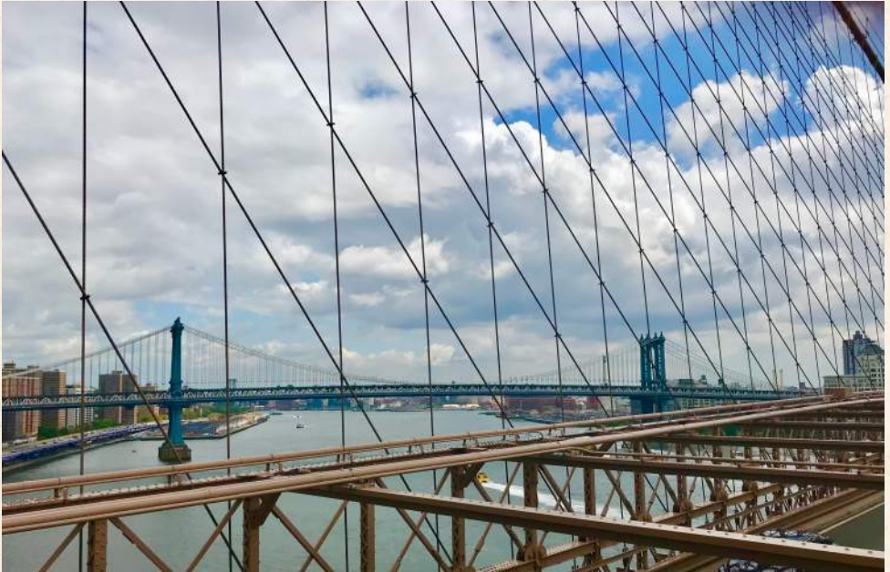
Cruce de líneas, Nueva York.