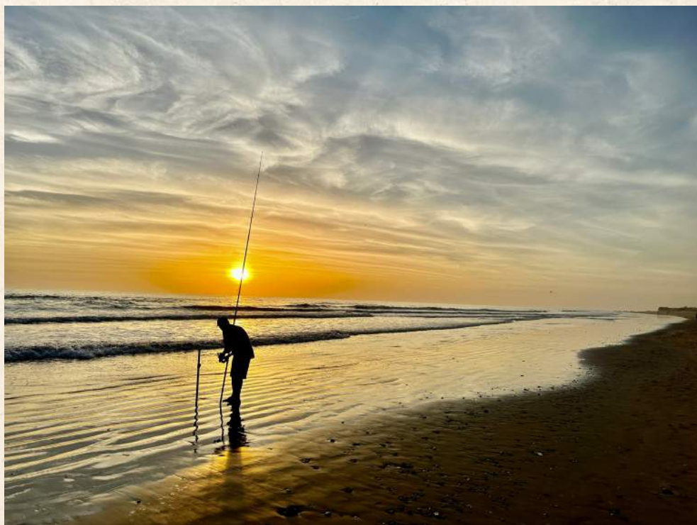
Pesca de sol.