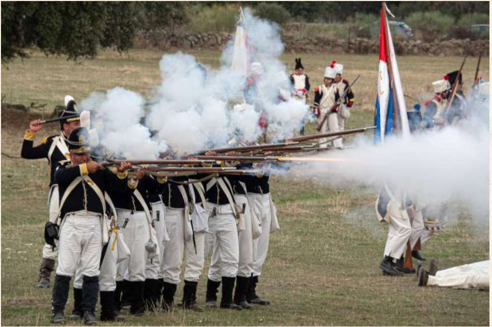
Batalla de la Sorpresa. Arroyomolinos de Montánchez.