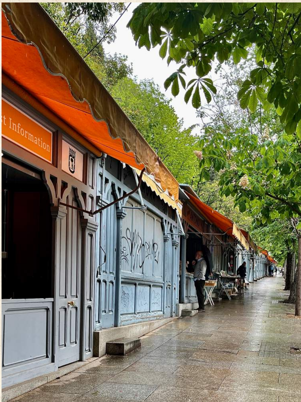
Las casas de las letras.